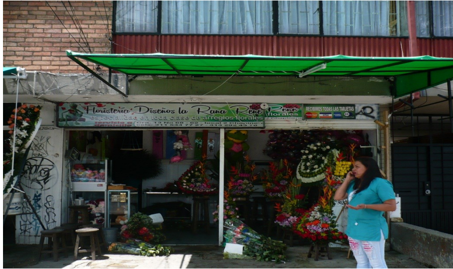
Fotografía No. 1: Establecimiento FLORISTERÍA DISEÑO LA RANA RENE ubicado en la Carrera 13 No 6862.

ALCALDÍA MAYOR DE BOGOTÁ D.C. SECRETARÍA DE AMBIENTE